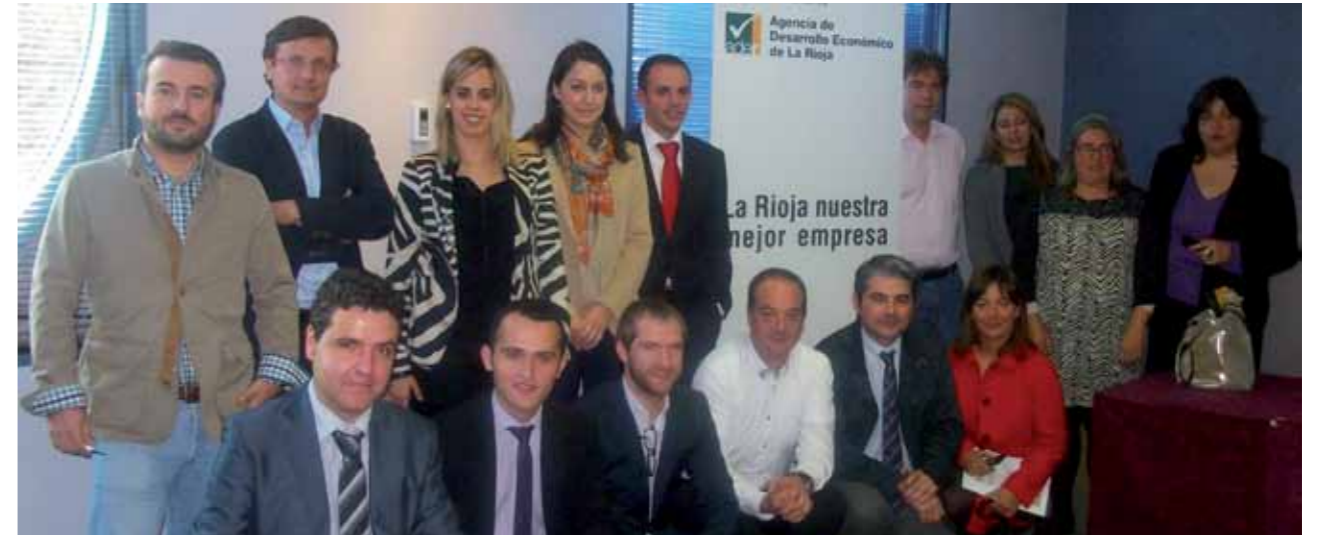
Participantes de la edición de 2013

URL: http://www.ifema.es/web/ferias/genera/default.html