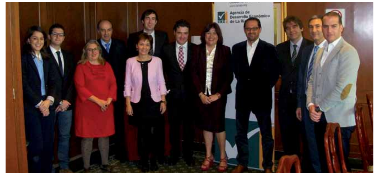
Participantes de la edición de 2012

En esta edición participarán un máximo de ocho entidades y la misión se desarrollará entre el 18 y el 23 de mayo de 2014. Previamente a la misma, se generarán unas intensas agendas de reuniones para cada uno de los participantes en función de sus intereses a través de la Oficina que la ADER dispone en México.